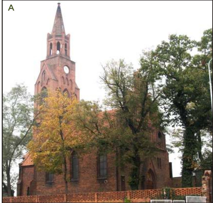
A - orientowany dawny kościół