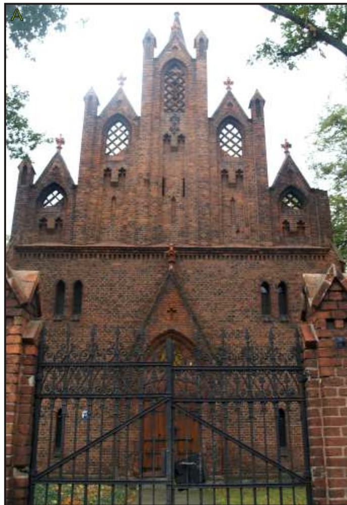
A - fasada