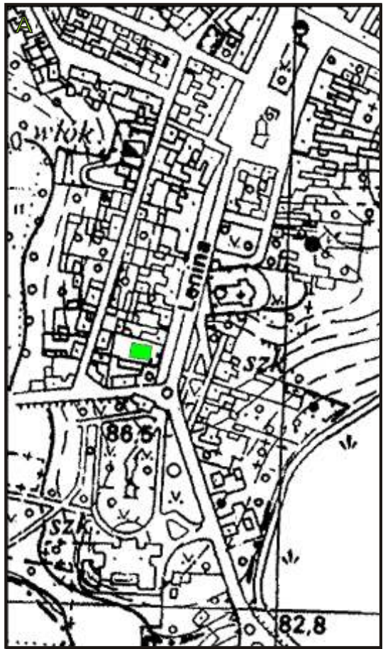
A - mapa topograficzna

7. Właściciel i jego adres: STAROSTWO POWIATOWE UL. CHOPINA 10 62-300 WRZESIŃ